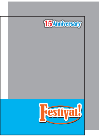
上の文字と下部のみ白版の場合 (白版を引いた部分以外は透けます。)