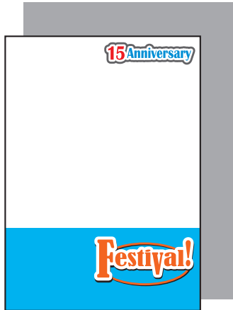
全面白版の場合 (全体に背景が透けにくくなります。)

クリアファイルの素材は透明なので、透けさせたくない部分と白色で表現したい部分は、K100%（黒）で白版を制作してください。