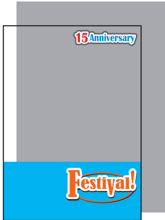
上の文字と下部のみ白版の場合 (白版を引いた部分以外は透けます。)