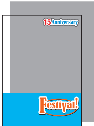
上の文字と下部のみ白版の場合 (白版を引いた部分以外は透けます。)